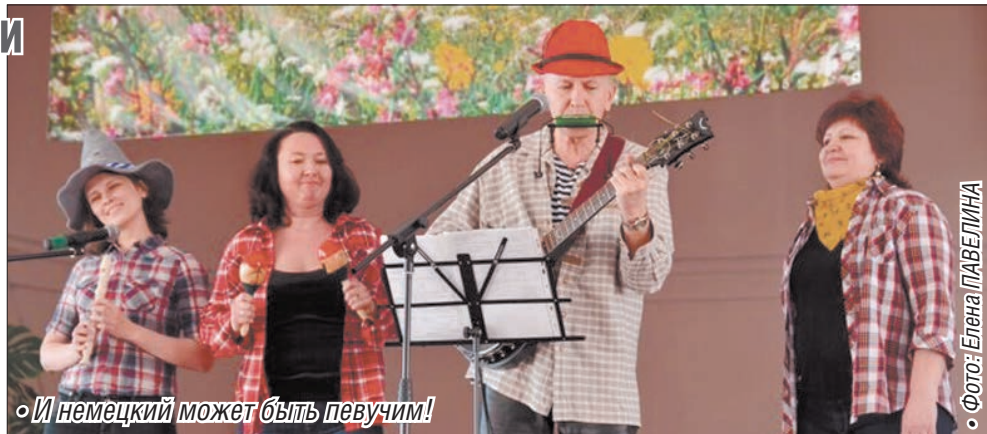
«И немецкий может быть певучим!»

Среди взрослых участников фестиваля лучше всех показал себя ансамбль немец-